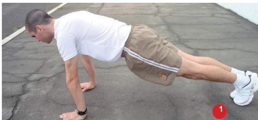
Posição Inicial: 1