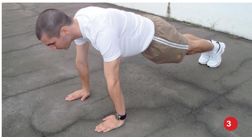
Posição final: 3